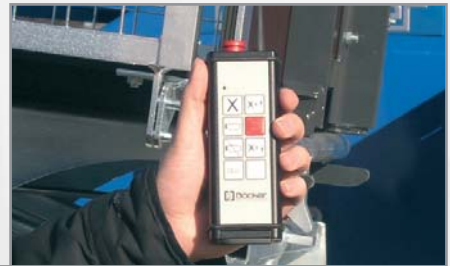
Elektrische Steuerung mit Funkhandsender für Bedienung von oben