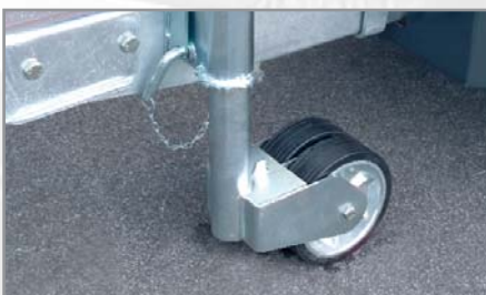
Stabiles Stützrad (optional als Doppelstützrad)