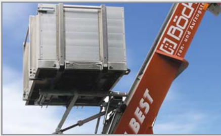
Stufenlose, gasfederunterstützte Verstellspindel 17°–87° (optional)