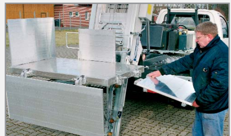
Seitenwände abklappbar 90°/180° und komplett abnehmbar