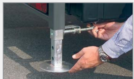
Verzinkte Kurbelfallstützen mit Rastbolzen