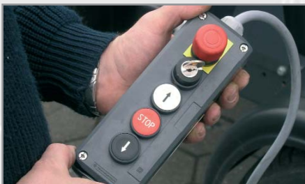
Elektrische Steuerung per Kabel- bedienung