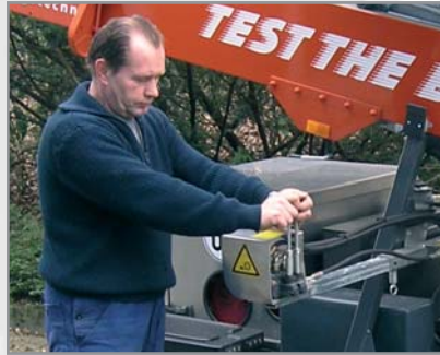
Bedienstand des Fahrantriebes