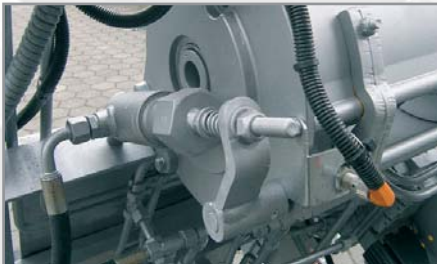
Automatische, hydraulische Klinkensperre (optional)