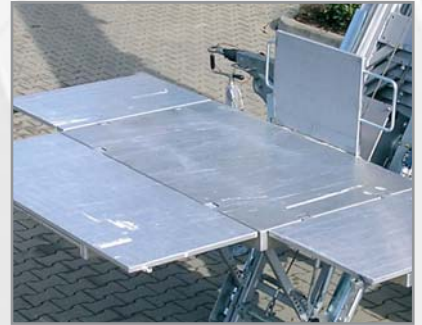
Absolut ebene Pritschenoberfläche