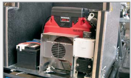
Extra leistungsstarke Motoren (z. B. Honda GX 620) mit Turbo-Schalter