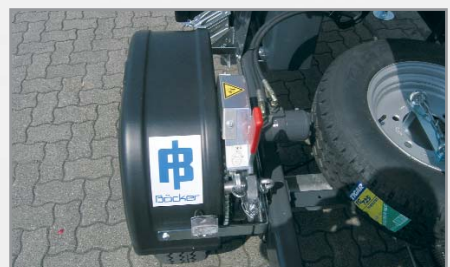
Formschlüssiger, leistungsstarker Selbstfahrantrieb (optional)