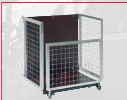
Universal-lastflak, 70 x 44 x 70 cm