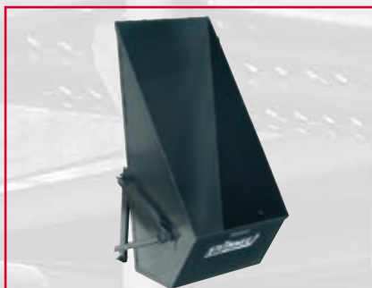
Tippskopa, 80 liter