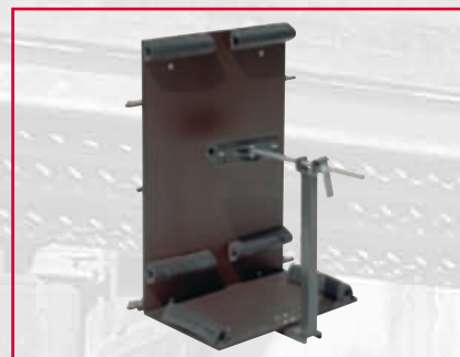
Lastflak för solcellspaneler