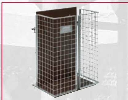
Universal-lastflak, 60 x 35 x 85 cm