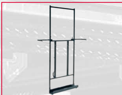
Lastflak för skivor, 90 x 15 x 220 cm