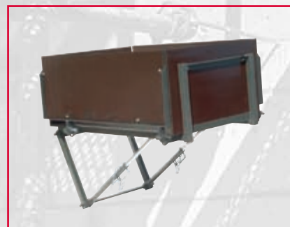
Plattform, 60 x 85 x 35 cm