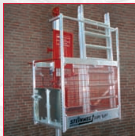
Korgen kan kompletteras med hållare för ställningsmaterial (höjd 1,8 m).