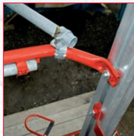
Mastförankring max. var 4:e m. Masten har profil för steglös infästning av mastförankringen.