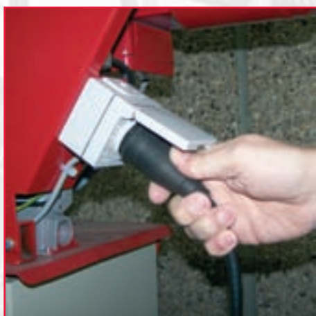
Handverktyg kan anslutas till ett 230 V nätuttag på åkvagnen.