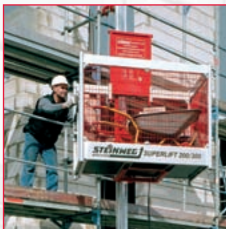
Med svängbar korg utförs arbetet säkert och med minimalt platsbehov.