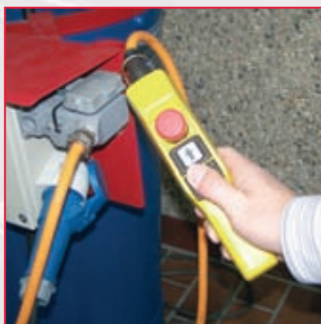
Manöverlåda med 5,0 m kabel. Manövrering från stannplanet kan erhållas som tillval.