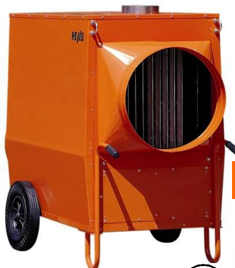
K 120 för hyresproffset