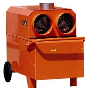
K 25 T Den kompakta