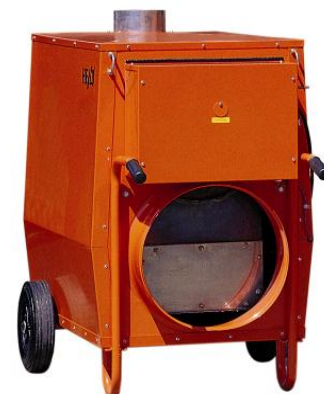
K 50 Den universella