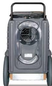
Hållare för spillvatten-slang/ nätkabel. Anslutningsstos för luftslang